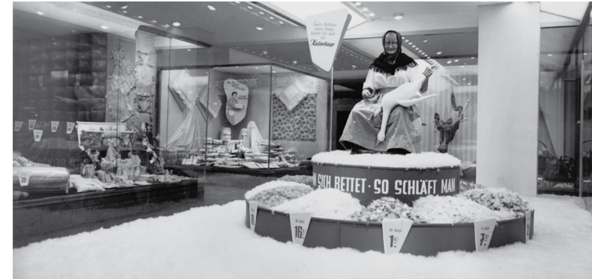
Schaufensterdekoration von 1954. Seit über 70 Jahren steht die Oma mit der Gans unter dem Motto »Wie man sich bettet so schläft man« als Markenzeichen für Qualität von Kalvelage.

Ein gutes Bett muss den individuellen Bedürfnissen seines Schläfers hinsichtlich Orthopädie, Hygiene und Material angepasst sein. Je angenehmer der Schlaf ist, umso mehr Energie steht ihm am Tag zur Verfügung. Exklusiv in Dortmund können die Kunden von Kalvelage Betten schon vor dem Bettenkauf sehen, wie gut sie später schlafen. Möglich macht das die Computer-Liegediagnose: Hunderte von Mess-Sensoren in den eigens dafür entwickelten Testmatratzen erfassen Körperform, Gewicht und Schwerpunkte des Schläfers. Auf einem Bildschirm entsteht ein dreidimensionales Abbild seines