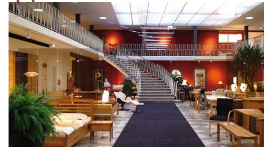
Der Verkaufsraum von Kalvelage heute