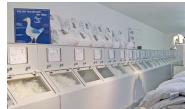
Daunen- und Federnfüllanlage

Persönliche Vorlieben bleiben beim Bettenkauf allerdings wichtig. Deshalb können die Kunden in der Daunen- und Federnfüllanlage von Kalvelage Betten Daunen und Federn unterschiedlichster Herkunft anschauen, anfassen und vergleichen. Das ist immer noch der beste Weg, das eigene »Traumbett« zu finden - abgestimmt auf das individuelle Wärmebedürfnis, den Feuchtigkeitstransport und den gewünschten Komfort.