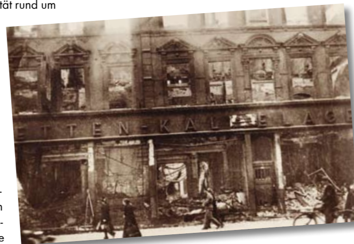
Das im Jahre 1945 teilweise zerstörte Bettenhaus wurde in den Nachkriegsjahren behelfsmäßig weitergeführt.