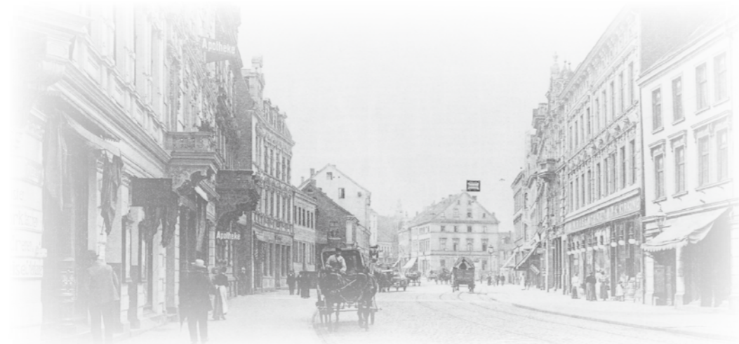
Münsterstraße um 1906: Schon damals gab es ein Bettenhaus in der Nummer 28.